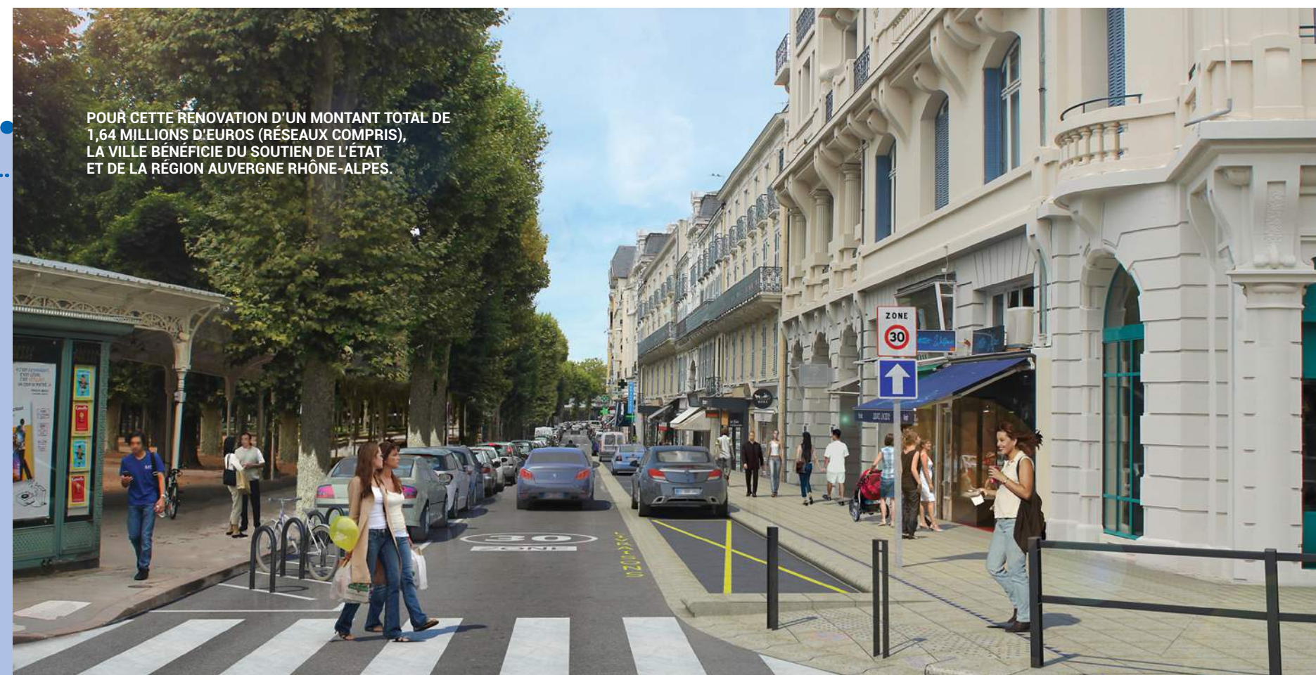
POUR CETTE RÉNOVATION D'UN MONTANT TOTAL DE 1,64 MILLIONS D'EUROS (RÉSEAUX COMPRIS), LA VILLE BÉNÉFICIE DU SOUTIEN DE L'ÉTAT ET DE LA RÉGION AUVERGNE RHÔNE-ALPES.

* Le Parc des Sources et les thermes appartiennent à l'État et sont gérés par la Cie de Vichy. Les discussions sur leur transfert se poursuivent entre l'État, la Ville et les autres collectivités.