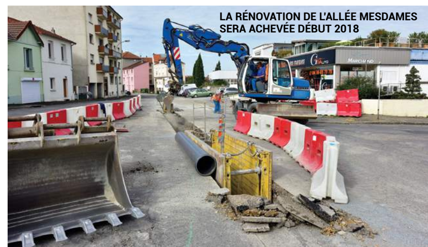
LA RÉNOVATION DE L'ALLÉE MESDAMES SERA ACHEVÉE DÉBUT 2018

La rénovation de la terrasse des vestiaires du Yacht-club débute : les dallages actuels, les plantations et la terre ont été enlevés pour permettre la reprise complète de l'étanchéité de toiture des vestiaires. D'ici janvier prochain, les skydomes seront remplacés, un revêtement asphalte recouvrira les zones accessibles et de nouveaux végétaux seront plantés au printemps dans la grande "jardinière", à l'entrée de l'Esplanade du Lac d'Allier. ■