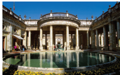
Montecatini Terme, Italie