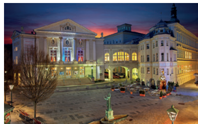
Baden bei Wein, Autriche