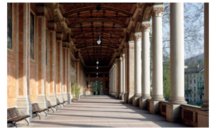
Baden Baden, Allemagne