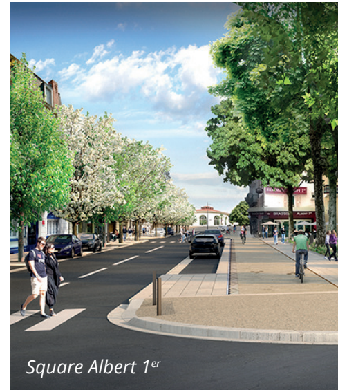
Square Albert 1 er

la fibre optique communale et le réseau téléphonique mais aussi le trottoir côté impair. Puis, entre mars et mi-avril, sur le même tronçon, les rénovations se poursuivront mais côté pair, avec la préfiguration de la future piste cyclable. La chaussée sera également rénovée pour la fin avril avant de passer à la phase suivante de réaménagement de la