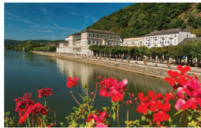
Bad Ems, Allemagne