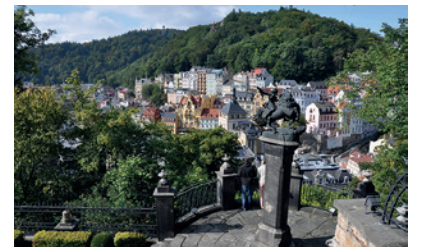
Karlovy Vary, République Tchèque