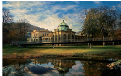
Bad Kissingen, Allemagne