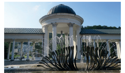
Mariánské Lázně, République Tchèque