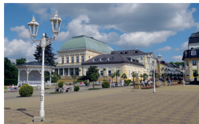
Františkovy Lázně, République Tchèque