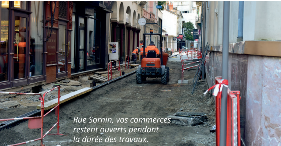
Rue Sornin, vos commerces restent ouverts pendant la durée des travaux.