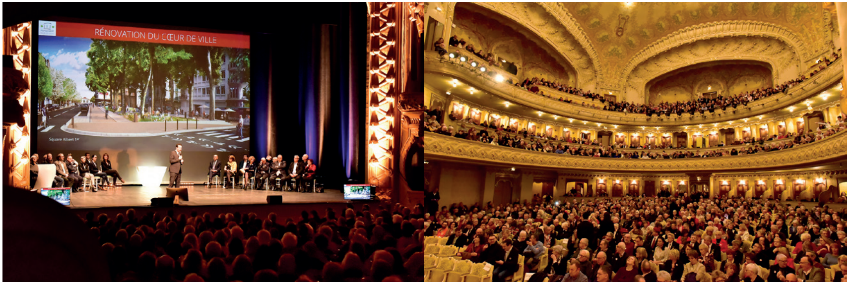
Plus de 1600 Vichyssoises et Vichyssois à l'Opéra ont assisté à la cérémonie des vœux le 17 janvier. Retrouvez la vidéo sur www.ville-vichy.fr/agenda/voeux-2019