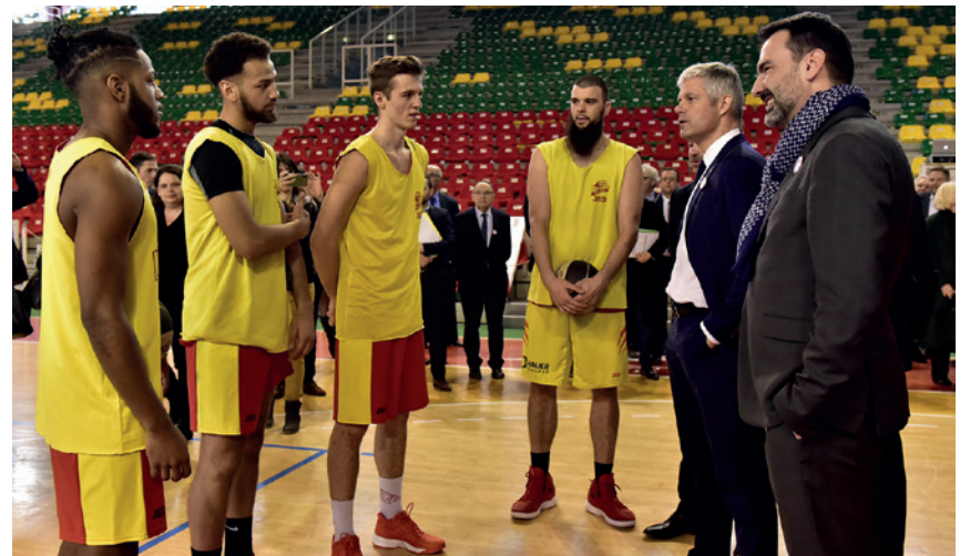
Laurent Wauquiez et Frédéric Aguilera avec les joueurs de la JAVCM lors de la signature du Pacte Régional pour l'Allier

bénéficiera au Centre Omnisports de nouveaux équipements (terrain couvert, vestiaires pro, halle...) pour accueillir les sportifs et équipes de haut niveau en stages ou lors de compétitions. La refonte du CREPS lui permettra de se positionner sur l'accompagnement de la performance des sportifs valides et handicapés. Au Sporting tennis, un «pôle terre battue» viendra compléter ce complexe... Les clubs locaux et le sport amateur bénéficieront aussi de ce nouveau plateau sportif, puisqu'un nouveau site sera créé à la Boucle des Isles (Bellerive-sur-Allier) pour les accueillir. ■