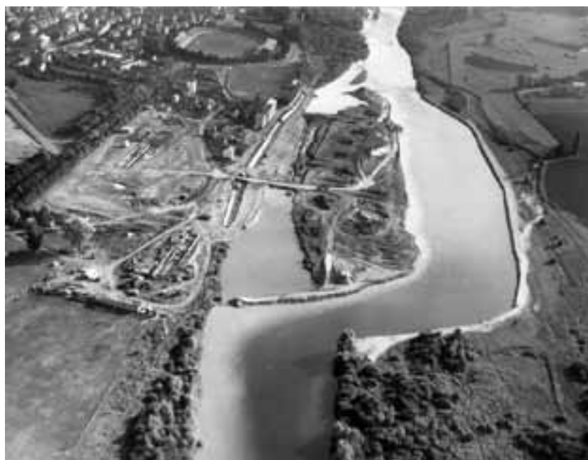
LA CITÉ DES AILES A ÉTÉ CONSTRUITE DANS LES ANNÉES 60, À LA MÊME PÉRIODE QUE LE PLAN D'EAU.

Dans chaque espace collectif et dans chaque appartement c'est donc une chasse aux déperditions d'énergie et de chaleur qui va s'opérer et ainsi apporter aux familles un gain de pouvoir d'achat significatif. En plus des travaux d'économie d'énergie -trois semaines maximum par appartement-, le confort de vie du logement sera amélioré avec notamment la réfection des salles de bains. Pour les personnes de 75 ans et plus ou à mobilité réduite, les baignoires seront remplacées par des douches. Enfin pour tous la gestion des dé-