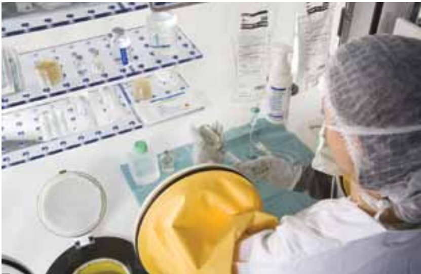
L'INNOVATION TECHNOLOGIQUE AU CŒUR DE LA POLITIQUE DE L'ENTREPRISE