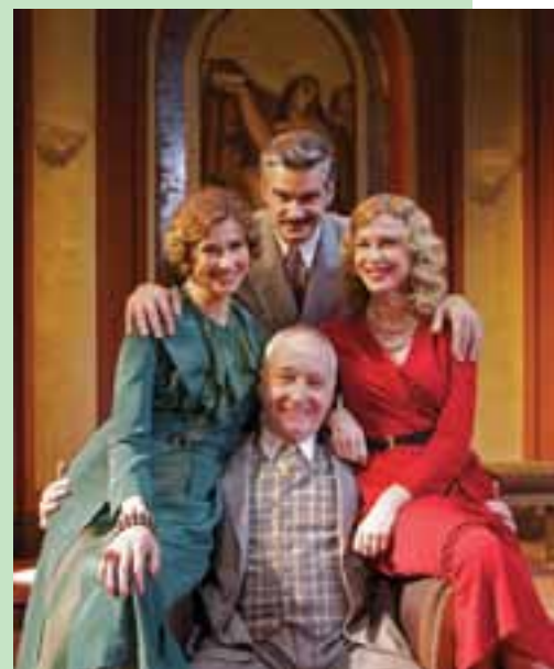
QUADRILLE LE 3 FÉVRIER À L'OPÉRA

• 18 h - Médiathèque Cycle de Conférences autour des littératures américaines avec