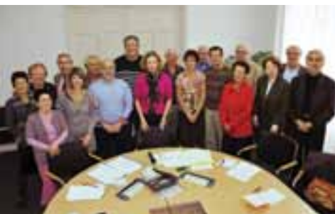
LES PRÉSIDENTS DE QUARTIERS SONT RÉGULIÈREMENT RÉUNIS POUR ÉCHANGER

Dix comités de quartier couvrent le territoire de la ville de Vichy. Chacun d'eux se singularise par ses actions et les activités qu'il propose à ses habitants/adhérents.