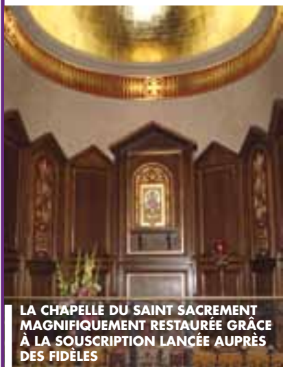
LA CHAPELLE DU SAINT SACREMENT MAGNIFIQUEMENT RESTAURÉE GRÂCE À LA SOUSCRIPTION LANCÉE AUPRÈS DES FIDÈLES