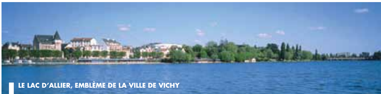
LE LAC D'ALLIER, EMBLÈME DE LA VILLE DE VICHY

Parallèlement à la rénovation du barrage pour garantir la pérennité du lac, la Ville s'apprête à engager un vaste chantier de mise en valeur et embellissement des berges.