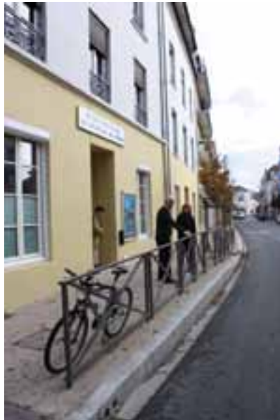
UNE ENTRÉE PLUS ESTHÉTIQUE ET PLUS SÉCURISÉE