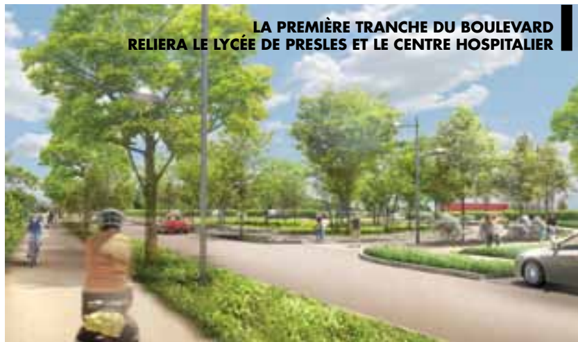
LA PREMIÈRE TRANCHE DU BOULEVARD RELIERA LE LYCÉE DE PRESLES ET LE CENTRE HOSPITALIER

Les travaux de la première tranche du boulevard Urbain réalisé par Vichy Val d'Allier, et reliant l'avenue de Gramont au Centre Hospitalier se poursuivent. Après près de 3 mois de chantier, les aménagements du carrefour du nouveau boulevard avec les avenues de Gramont à Vichy et de Vichy à Cusset ont été réalisés ; l'aménagement de l'avenue de la Libération (chaussée à double-sens et trottoir côté Lycée de Presles y compris la piste cyclable) est en cours de finalisation. La circulation a été rétablie avenue de Gramont dans le nouveau carrefour. En parallèle, les travaux sur les réseaux, notamment de collecte des eaux pluviales, se poursuivent. Les travaux vont continuer, par la réalisation de la cour urbaine de la rue de Vendée (desserte des habitations de la rue, création des futurs espaces de plantations et d'une poche de stationnement) entre janvier et mars 2013.