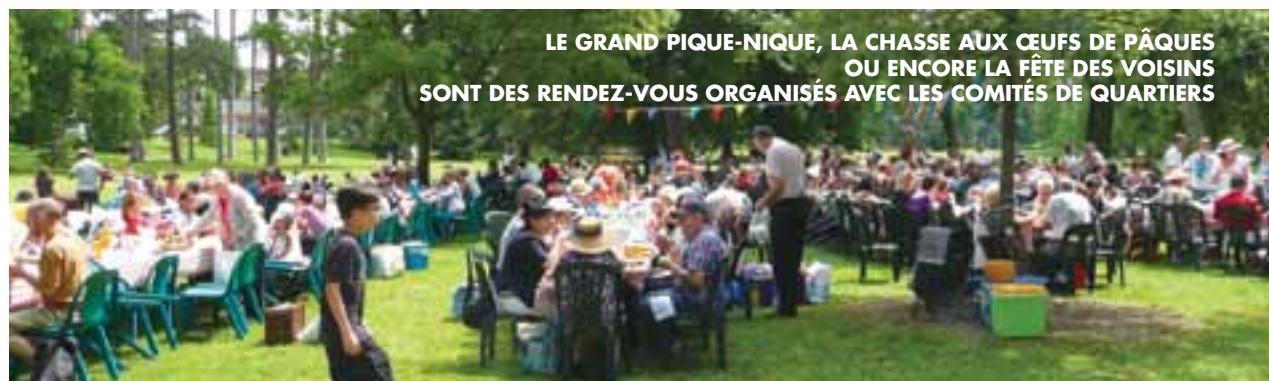
LE GRAND PIQUE-NIQUE, LA CHASSE AUX ŒUFS DE PÂQUES OU ENCORE LA FÊTE DES VOISINS SONT DES RENDEZ-VOUS ORGANISÉS AVEC LES COMITÉS DE QUARTIERS