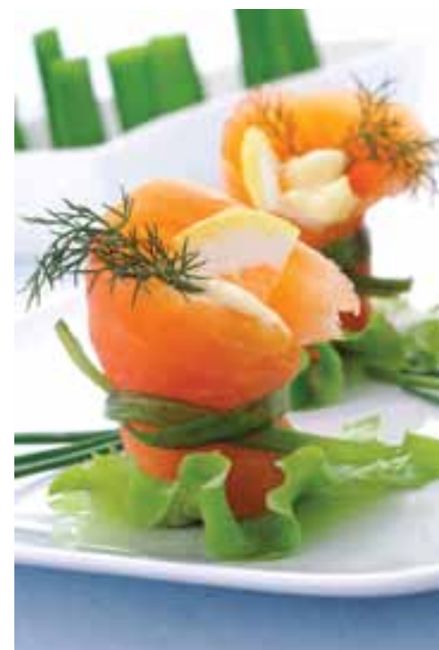
SIX JOURS DE PRÉPARATION SONT NÉCESSAIRES AVANT LA DÉGUSTATION D'UN BON SAUMON FUMÉ

dans un nouveau projet d'avenir. Un laboratoire est en construction dans l'atelier. C'est là que seront fabriqués les futures saucisses, merguez, boudins blancs et rillettes de saumon de la marque. L'ancien boucher n'a rien oublié de son premier métier. ■