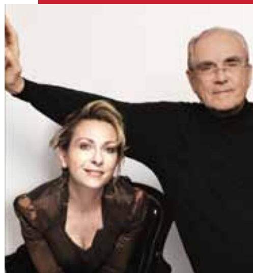
NATALIE DESSAY, SOPRANO CHANTE MICHEL LEGRAND À L'OPÉRA LE 7 DÉCEMBRE