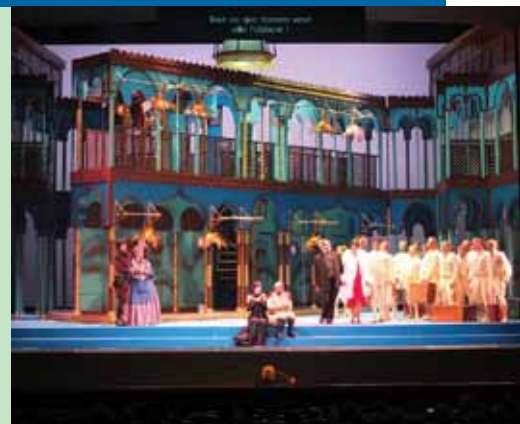
L'ITALIENNE À ALGER À L'OPÉRA

Journées du patrimoine - Cette trentième édition aura pour thème 1913-2013, cent ans de protection