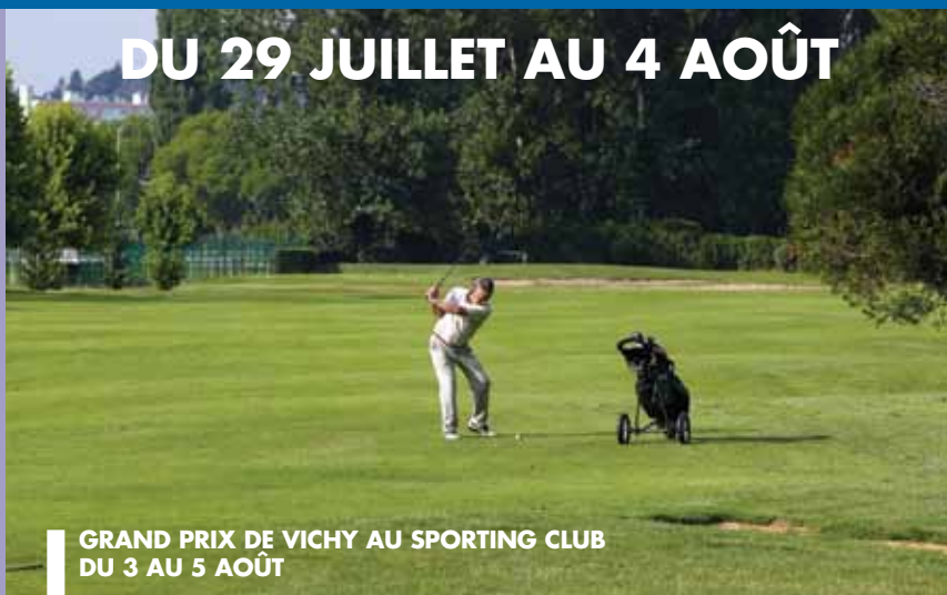
GRAND PRIX DE VICHY AU SPORTING CLUB DU 3 AU 5 AOÛT