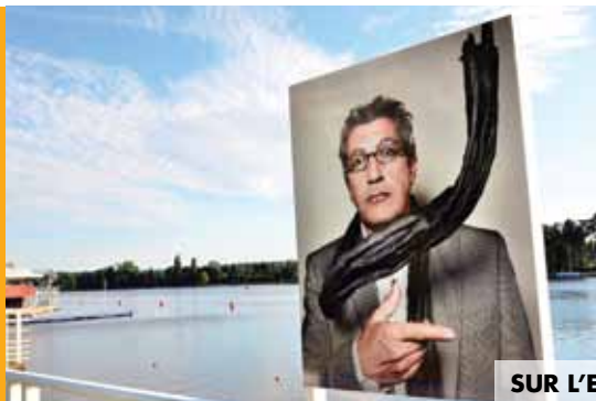
SUR L'ESPLANADE 60 PORTRAITS SIGNÉS JÉRÔME BONNET