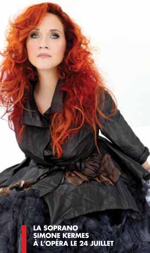
LA SOPRANO SIMONE KERMES À L'OPÉRA LE 24 JUILLET