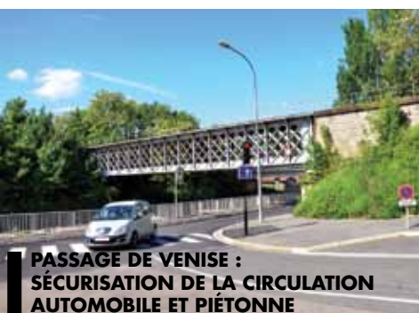
PASSAGE DE VENISE : SÉCURISATION DE LA CIRCULATION AUTOMOBILE ET PIÉTONNE

Après la rue d'Auvergne et la chaussée de la rue du Massif Central, la rue du Pré Fleuri est en pleine réfection. L'allée des