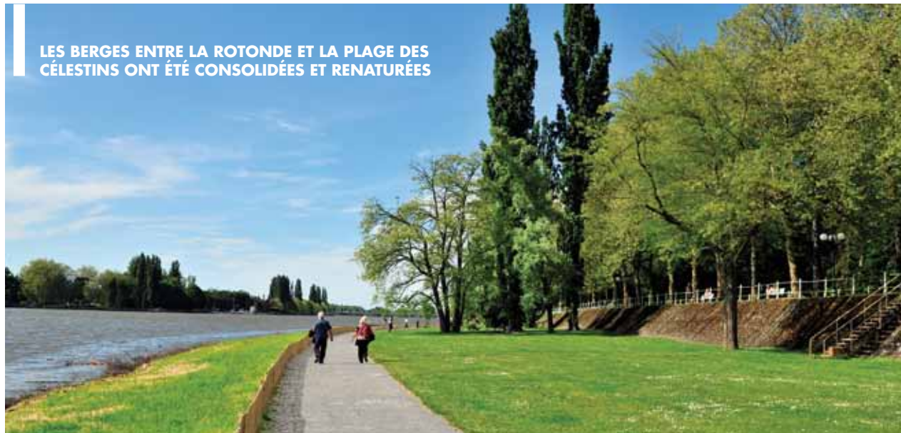
LES BERGES ENTRE LA ROTONDE ET LA PLAGE DES CÉLESTINS ONT ÉTÉ CONSOLIDÉES ET RENATURÉES