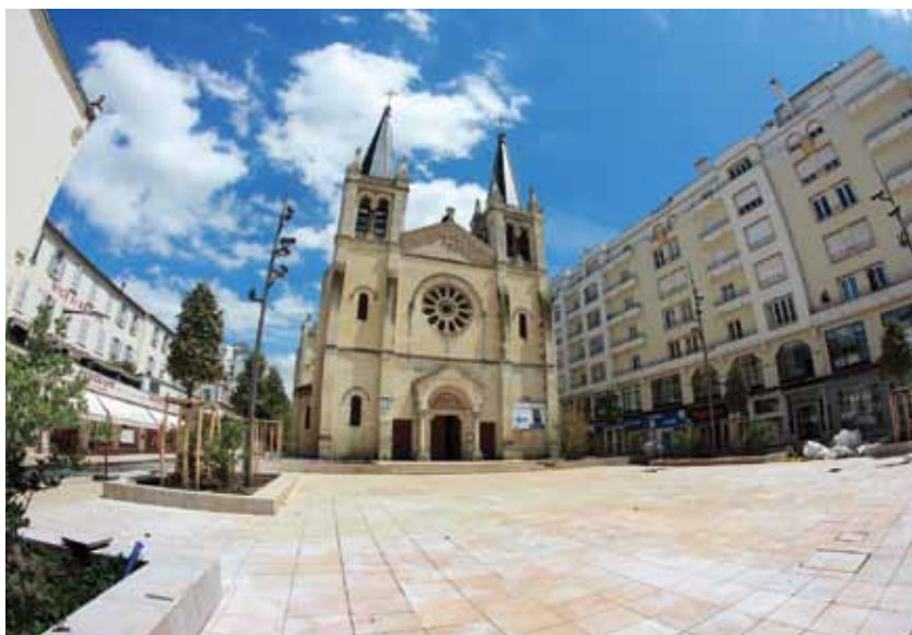
LA RUE SAINTE-CÉCILE ET LE PARVIS SONT EN COURS D'ACHÈVEMENT ET LA RUE SAINTE-BARBE SERA TERMINÉE MI-JUILLET

Au sol, le nouveau parvis et ses abords dévoilent déjà leur aspect définitif. Tous les réseaux sont terminés et l'éclairage public est en place. Après la rue Sainte-Cécile et le parvis, c'est au tour de la rue Sainte-Barbe d'être dallée. Dernière phase pour ce grand chantier qui s'achèvera mi-juillet, avec deux mois d'avance !