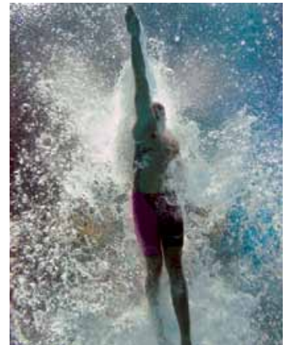
FLORENT MANAUDOU SERA AU RENDEZ-VOUS DE L'OPEN DE FRANCE

Pour la 3 ème année, les triathlètes participant au Challenge Vichy, vont affronter l'épreuve ultime le 1 er septembre : se plonger, de bon matin, dans les eaux de l'Allier pour 3,8 km de natation, enchaîner avec une petite virée de 180 km à vélo et finir par un marathon. Une promenade de santé (!)... qui