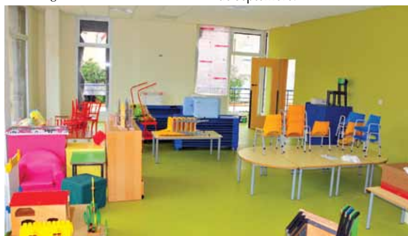
L'ÉCOLE LYAUTEY RÉNOVÉE ET AGRANDIE SERA PRÊTE POUR LA PROCHAINE RENTRÉE

Cet automne, la Ville réaménagera, la contre-allée du boulevard de Lattre de Tassigny. La concertation avec les riverains se termine. L'accessibilité sera améliorée et le nombre de places de stationnement augmenté de 40 environ.