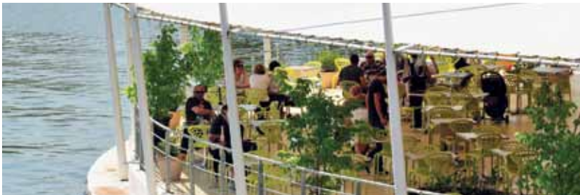
VUE IMPRENABLE SUR LA RIVIÈRE DEPUIS LES TERRASSES DES RESTAURANTS ET LES BELVÈDÈRES DE L'ESPLANADE

ans en ce mois de juin 2013. vichyssois et au cœur de toutes les attentions. laisser admirer.