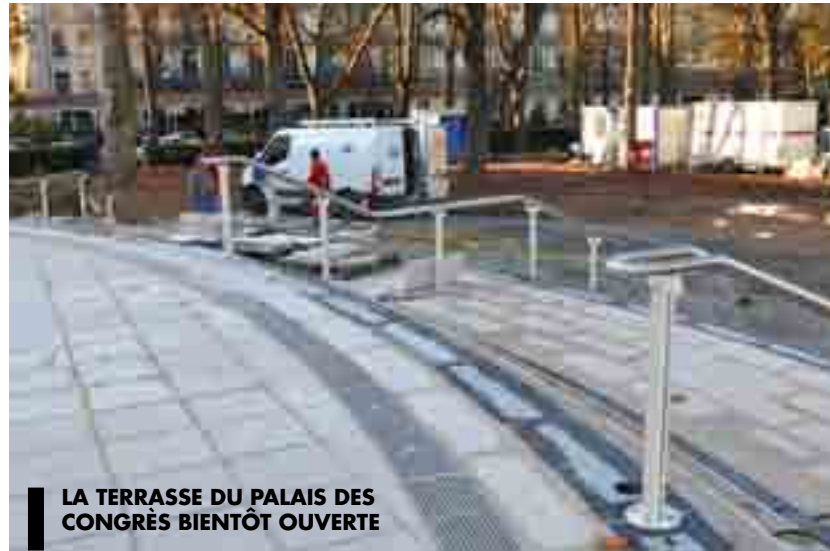
LA TERRASSE DU PALAIS DES CONGRÈS BIENTÔT OUVERTE