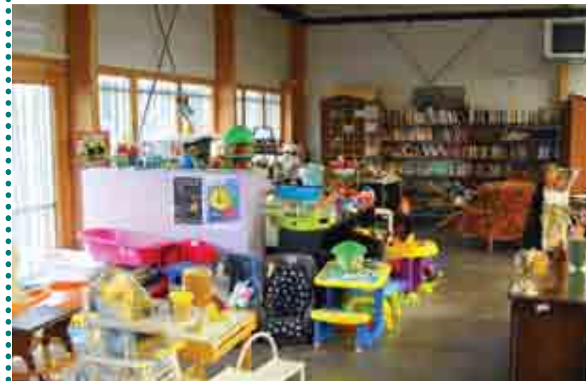
NETTOYÉS ET RÉPARÉS, LES JOUETS SONT PRÊTS POUR NOËL !

En un an d'activité, la Recyclerie a traité plus de soixante tonnes d'objets divers. Ses agents, en parcours d'insertion, les ont triés, nettoyés, réparés, leur donnant ainsi une seconde vie.