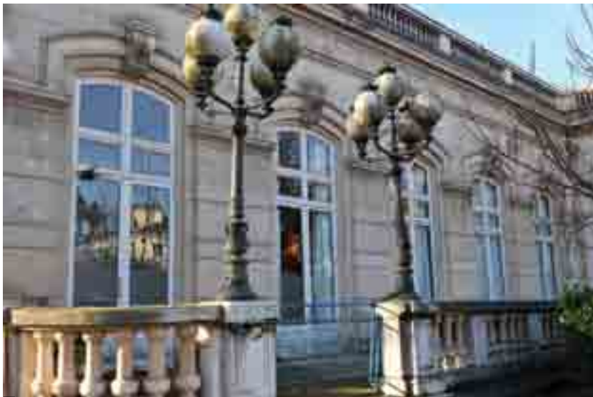
LA FAÇADE DU RELAIS DES PARCS SERA PROCHAINEMENT RÉNOVÉE

La Direction régionale des affaires culturelles (DRAC) vient d'autoriser cette restauration. L'architecte en chef des Monuments Historiques peut ainsi poursuivre ses