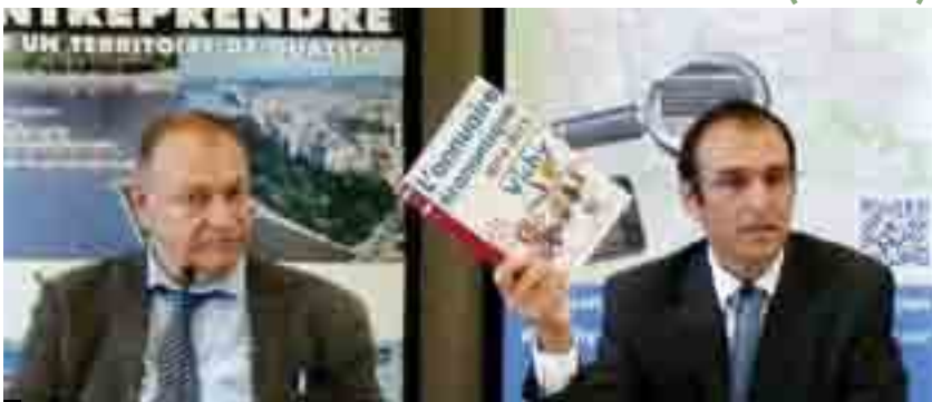
LANCEMENT DE L'ANNUAIRE 2014-2015 PAR LE PRÉSIDENT ET LE DIRECTEUR DE VVAD

Créé par la Ville de Vichy il y a 25 ans, l'Agence de développement économique Vichy Val d'Allier Développement (VVAD) accompagne les politiques économiques des Élus de l'agglomération avec pour mission principale de développer les nouvelles activités par des créations, des reprises ou transformations d'entreprises existantes. En support de ses missions, VVAD publie chaque année son annuaire économique à 8000 exemplaires. 1 700 fiches d'entreprises, collectivités et forces vives, une synthèse du territoire et de multiples infos pratiques permettent d'avoir un aperçu du tissu économique de notre bassin d'emploi. Un cahier spécial