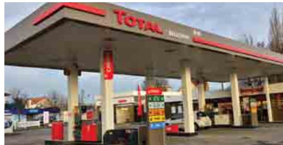
LA STATION-SERVICE DE BELLERIVE-SUR-ALLIER A ÉTÉ LA PREMIÈRE EN JUILLET DERNIER À ARBORER LES NOUVELLES COULEURS DE TOTAL.

Le destin de l'entreprise familiale Lagarde, fondée à Cusset en 1928, est lié depuis juillet 1954 à celui de la Compagnie française des pétroles (CFP), devenue le géant Total. Tout en conservant son indépendance et un fort retentissement local.