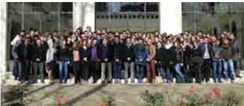
LE 9 DÉCEMBRE L'IEQT CÉLÈBRE SES 25 ANS AU PALAIS DES CONGRÈS OPÉRA

L'INSTITUT EUROPÉEN DE LA QUALITÉ TOTALE