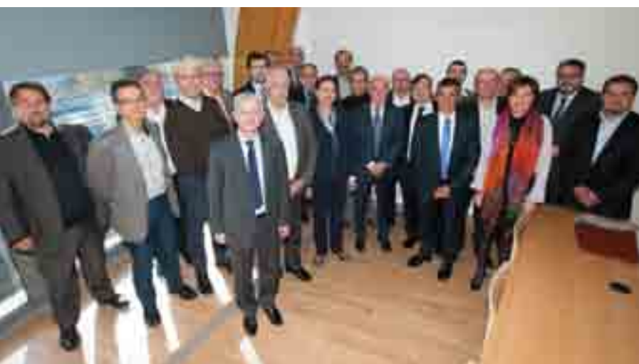
LES ÉLUS REPRÉSENTANT 10 COMMUNAUTÉS D'AGGLOMÉRATION ET DE COMMUNES AUTOUR DE CLERMONT-FERRAND, ISSOIRE, THIERS, RIOM ET VICHY

La communauté d'agglomération Vichy Val d'Allier préside depuis le 8 novembre dernier le Syndicat Mixte Métropole Clermont Vichy Auvergne avec à sa tête Claude Malhuret. L'occasion de découvrir cet espace de réflexion au service d'un plus vaste territoire qui, autour de Clermont-Ferrand, s'étend d'Issoire jusqu'à Vichy