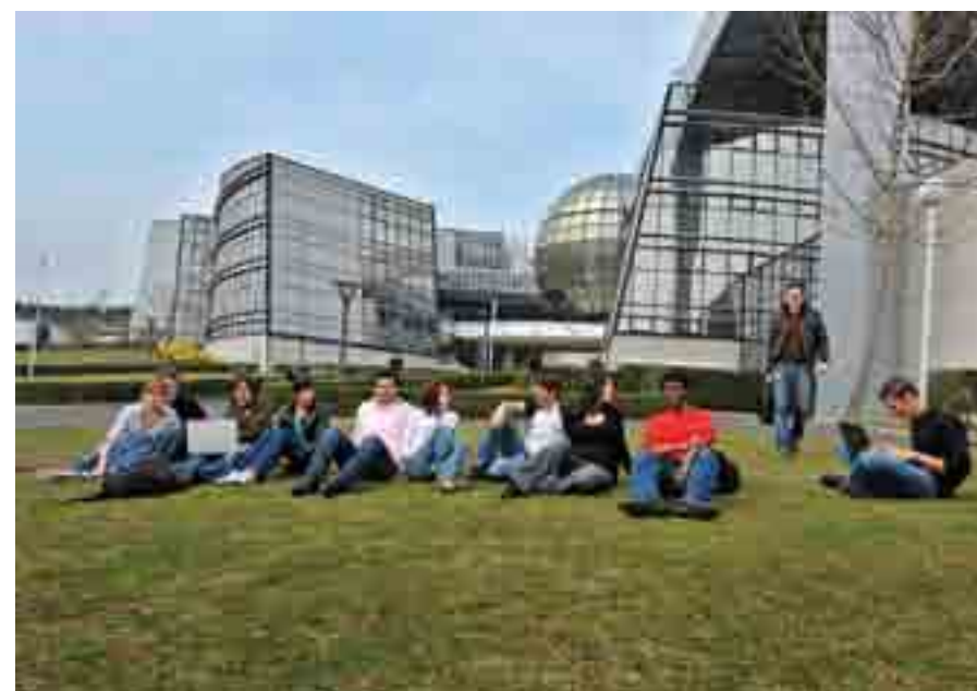
L'UN DES ENJEUX MAJEURS DE LA MÉTROPOLE EST L'ENSEIGNEMENT SUPÉRIEUR, AVEC À VICHY LE DÉVELOPPEMENT DES FORMATIONS PARAMÉDICALES NOTAMMENT

Pour des milliers d'Auvergnats, l'axe Clermont-Ferrand / Vichy est un espace naturel de vie au quotidien.