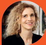
Delphine DE VIGAN