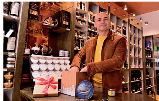
Art et Saveurs 3 rue du Président Roosevelt