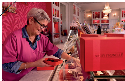
Vichy Prunelle - 36 rue Montaret