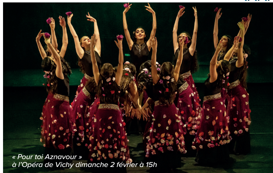
« Pour toi Aznavour » à l'Opéra de Vichy dimanche 2 février à 15h

Les scènes, empreintes de puissance et d'émotion, explorent les racines arméniennes, l'exil tragique et la beauté de la jeunesse. Les chansons d'Aznavour accompagnent un voyage mémoriel poignant, évoquant le tremblement de terre de 1988, les disparus et les derniers mots de Missak Manouchian à son épouse. Cette œuvre chorégraphique est une poésie visuelle, entre mémoire, espoir et musique, où chaque danse et mélodie est un hommage à l'amour et à la résilience.