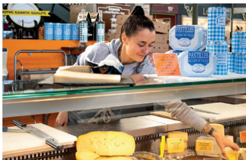
Crèmerie du Grand Marché au Grand Marché