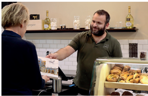
Ladvie - 5 rue du président Roosevelt