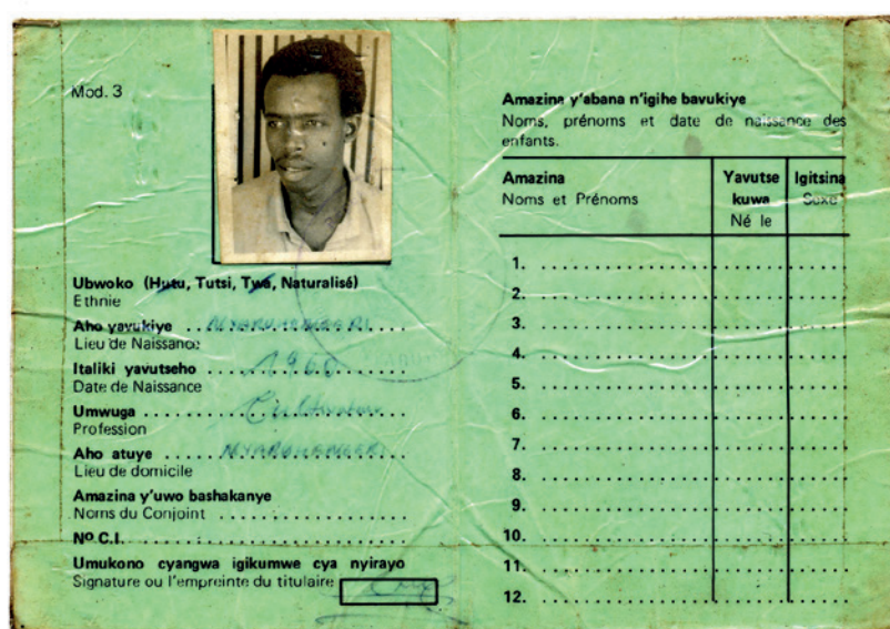
Carte d'identité portant la mention Tutsi (n° 17480). En 1932, les Belges instaurent l'usage de la carte d'identité qui divisera le peuple rwandais en trois catégories ethniques, Hutu, Tutsi et Twa, désormais hétérogènes. En 1994, les cartes d'identité désigneront les Tutsi aux tueurs.