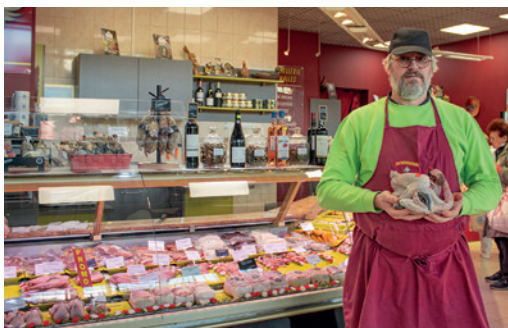
La volaillerie des halles au Grand Marché