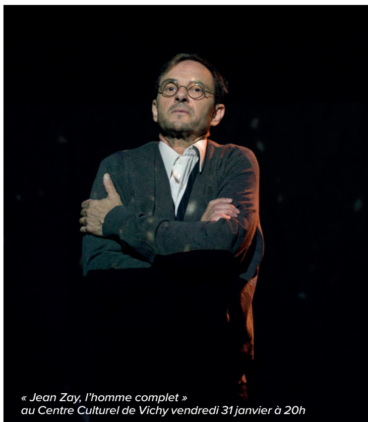
« Jean Zay, l'homme complet » au Centre Culturel de Vichy vendredi 31 janvier à 20h

Ce seul en scène retrace la vie et l'œuvre de Jean Zay, avocat et homme politique né en 1904, assassiné dans l'Allier par des miliciens en 1944. Figure emblématique du front populaire, ministre visionnaire et bâtisseur de l'école publique, Jean Zay fut également résistant, écrivain et intellectuel d'une immense culture. Après quatre ans d'emprisonnement à Marseille puis à Riom, il est abattu par des miliciens le 20 juin 1944 près de la carrière des Malavaux, connue sous le nom de « Puits du diable ». Son récit de captivité, éclairant sur son époque, est un texte d'une grande valeur historique et humaniste. Ce spectacle, à la