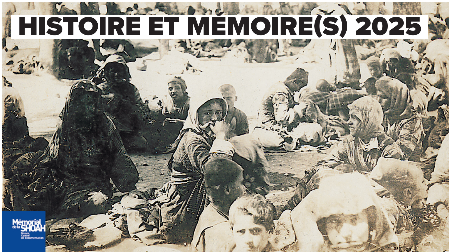
Convoi de déportés au repos au Nord d'Alep.

« Histoire et Mémoire(s) », c'est une semaine d'événements organisée chaque année dans le cadre de la politique mémorielle de la Ville de Vichy, qui souhaite renforcer ses actions pour la mémoire des génocides et pour la prévention des crimes contre l'humanité afin de rappeler les valeurs humanistes et les principes juridiques qui fondent notre démocratie.