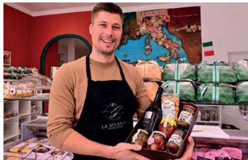
La Golosita - 20 rue Maréchal Foch

Cette liste est non exhaustive, tous vos commerçants Vichyssois seront ravis de vous accueillir pour préparer les fêtes de fin d'année.