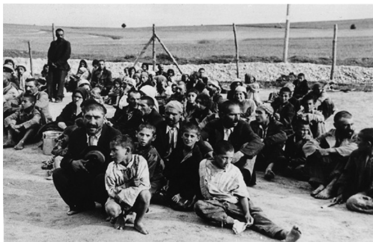
La Pologne conquise est envisagée comme une zone de recolonisation qui doit être purifiée des Juifs, des politiques et des Tsiganes. Cette image, prise par un SS, montre le parcage de Tsiganes dans le camp de travail de Belzec. Ce camp sera transformé en 1942 en centre de mise à mort dans le cadre de l'Aktion Reinhard. Pologne, circa 1941-1942.