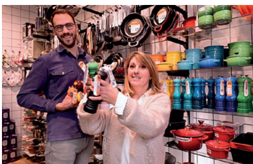
Culin'art - 12 rue de l'Hôtel des postes