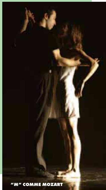
"M" COMME MOZART

Animation musicale avec Moda Latina, flamenco gipsy