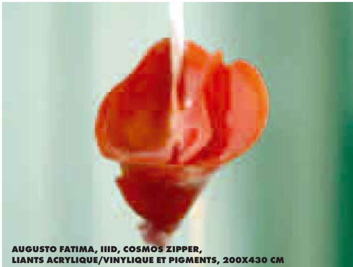
AUGUSTO FATIMA, IIID, COSMOS ZIPPER, LIANTS ACRYLIQUE/VINYLIQUE ET PIGMENTS, 200X430 CM

collectionneurs décernera trois prix : Prix de la meilleure œuvre en 2 Dimensions (peinture), Prix de la meilleure œuvre en 3 Dimensions (sculpture, installation) et Prix Flash (photographie ou vidéo). Le public lui-même sera impliqué et décernera son prix : les visiteurs voteront entre le 24 juin et le 6 juillet pour les œuvres qu'ils ont préférées. La remise des prix aura lieu le 7 juillet à 19 h. Quatre prix de 1 000 euros seront remis par la Ville aux lauréats afin qu'ils puissent financer leur propre exposition, présentée au Centre culturel en 2007 et 2008. Cette dotation souligne la volonté affirmée de la Ville de soutenir la création contemporaine, lequel rencontre chaque année un public plus nombreux. ■