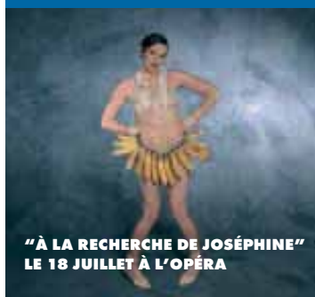
"À LA RECHERCHE DE JOSÉPHINE" LE 18 JUILLET À L'OPÉRA