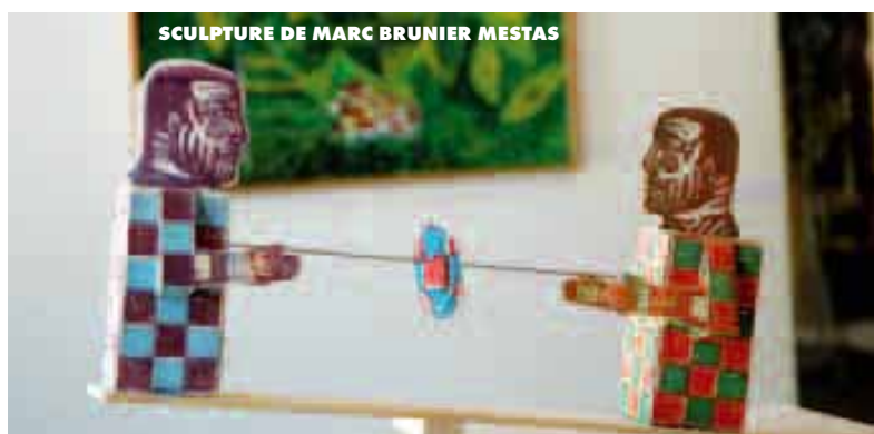
SCULPTURE DE MARC BRUNIER MESTAS

• Suzanne et Didier Scheiner : un terrain de rugby "poétique" résumé à une fleur grand ouverte, assaillie jusqu'en son cœur ovale par une marée de corps anonymes regroupés en mêlée – emmêlés. Tous sont réduits à la plus simple expression de la tension collective vers l'objectif, unis dans la même énergie. • Marc Brunier Mestas : une balançoire de bois sortie tout droit de l'enfance, sur laquelle deux joueurs se font face et se disputent un ballon de bois multicolore, suspendu sur un fil – le fil du jeu et des passes intemporelles. • Antoine Lopez : à côté des effusions artistiques les plus débridées se détache, du fait de sa sobriété, ce trophée maori : une noix de coco couverte de symboles dorés. On sentirait presque, rehaussé encore par cette modeste simplicité, le plaisir immense de la victoire.