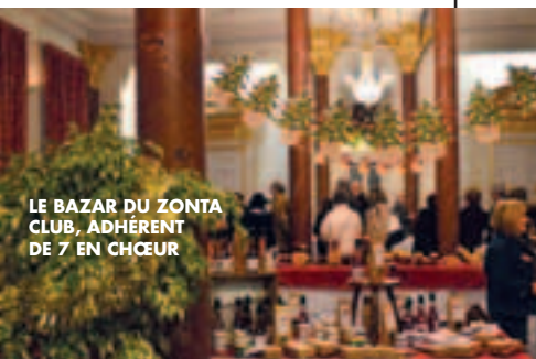
LE BAZAR DU ZONTA CLUB, ADHÉRENT DE 7 EN CHŒUR

Grand loto organisé par l'association 7 en chœur qui regroupe 7 clubs vichyssois -Kiwanis, Lions Club Vichy Doyen, Rotary Doyen, Rotary Val de Besbre, Soroptimist, Table Ronde et Zonta Club- au profit, pour la deuxième année consécutive de l'équipement d'une aire de jeux sécurisée pour les jeunes enfants, prochainement implantée par la Ville en rive gauche (à proximité de la Tour des Juges). Nombreux gros lots à gagner : home-cinéma, voyage, électroménager, VTT, etc... Venez nombreux ! Le dimanche 16 mars à 14h au Palais du Lac