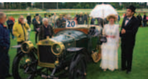
LE 14 SEPTEMBRE DERNIER L'AUTOMOBILE CLUB DE VICHY FÉTAIT SES 100 ANS À L'HIPPODROME. UNE CENTENAIRE POUR UN CENTENAIRE : UNE DELAGE RUNABOUT DE 1913 ET SON ÉQUIPAGE EN COSTUME D'ÉPOQUE