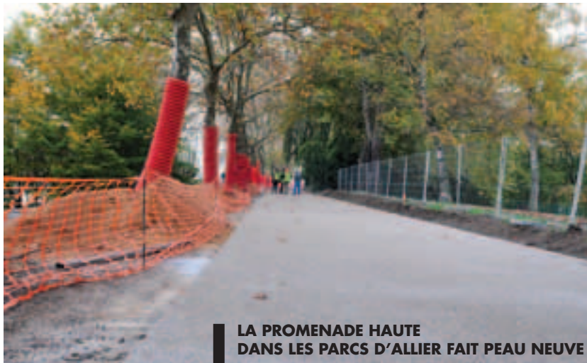
LA PROMENADE HAUTE DANS LES PARCS D'ALLIER FAIT PEAU NEUVE