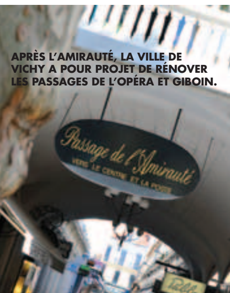
APRÈS L'AMIRAUTÉ, LA VILLE DE VICHY A POUR PROJET DE RÉNOVER LES PASSAGES DE L'OPÉRA ET GIBOIN.

*inscrit dans la ZPPAUP (Zone de Protection du Patrimoine Architectural, Urbain et Paysager de Vichy : portion du territoire à protéger ou à mettre en valeur pour des motifs d'ordre esthétique ou historique).