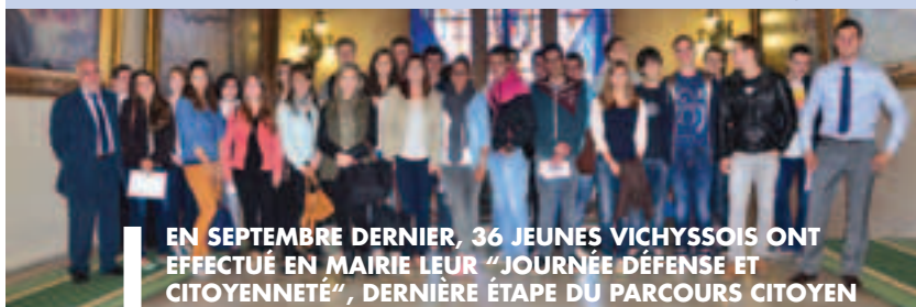
EN SEPTEMBRE DERNIER, 36 JEUNES VICHYSOIS ONT EFFECTUÉ EN MAIRIE LEUR "JOURNÉE DÉFENSE ET CITOYENNETÉ", DERNIÈRE ÉTAPE DU PARCOURS CITOYEN

Le Centre Communal d'Action Sociale de Vichy (CCAS) peut vérifier vos carnets de vaccination et faire gratuitement les rappels de vaccination manquants ( vaccins fournis par le CCAS ) : diphtérie, tétanos, poliomyélite (DTP), coqueluche, hépatite B, rougeole, oreillons, rubéole (ROR) et méningocoque C. Les prochaines séances de vaccination adultes et enfants (à partir de 6 ans) sont organisées les mardis 7 janvier, 18 février et 18 mars 2014 de 17h à 19h. Pensez à vous munir du carnet de vaccination. CCAS - Centre de Vaccinations, 21, rue d'Alsace - Tél. 04 70 97 18 50 ■