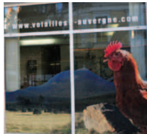
LE SYNDICAT DE DÉFENSE DES VOLAILLES FERMIERES D'Auvergne (SYVOFO) DONT LE SIÈGE SOCIAL RUE DE PARIS AFFICHE LA BONNE SANTÉ DE SES VOLAILLES