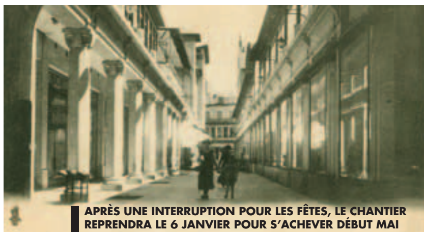
APRÈS UNE INTERRUPTION POUR LES FÊTES, LE CHANTIER REPRENDRA LE 6 JANVIER POUR S'ACHEVER DÉBUT MAI

Vitrines, verrières, structures métalliques, boutiques anciennes... les passages de Vichy, véritables rues privées -parfois couvertes- au décor si particulier, font le lien entre le centre commerçant et le quartier thermal historique. Passages de l'Opéra, Giboin et de l'Amirauté... Ces ancêtres des centres commerciaux nous incitent à la balade et au shopping.