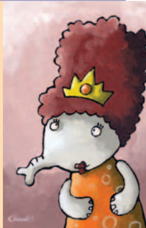
EXPO PEINTURE AU PIJ JUSQU'AU 20 DÉCEMBRE

15 rue Maréchal Foch 04 70 32 12 97 Collections de peintures et sculptures des 19 ème et 20 ème siècles ;