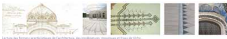
Lecture des formes caractéristiques de l'architecture, des modulations, motifs et frises de Vichy.

Pour Carlos Goncalves, architecte de la Promenade, "les kiosques opaques mais aussi translucides et colorés sont autant de lanternes magiques posées sur les berges de la rivière".