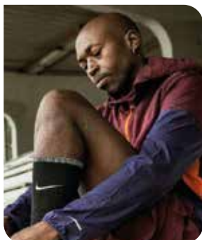
Jean-Baptiste ALAIZE Athlète paralympique

Table ronde avec Jean-Baptiste ALAIZE et Paul DIETSCHY