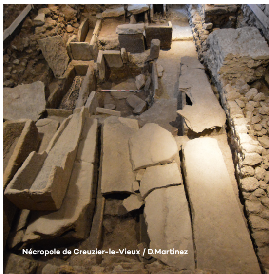
Nécropole de Creuzier-le-Vieux / D.Martinez