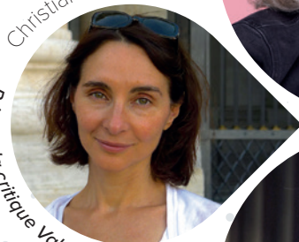
Prix de la critique Valéry-Larbaud