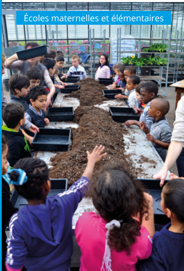
Écoles maternelles et élémentaires

Le service des Espaces Verts propose aux écoles de Vichy des visites des Parcs d'Allier ( découverte botanique ou historique ), du Centre de production horticole ( production et stockage des plantes, techniques horticoles... ) et des animations ( ateliers semis, repiquage, rempotage, participation aux plantations... ).