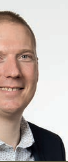
TRY Municipal espaces verts