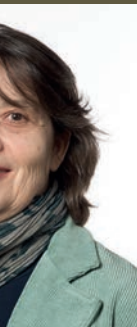
ARRA Municipale développement du partenariats et au