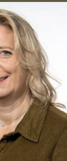
SALLE Maire Sécurité du Ressources l'administration