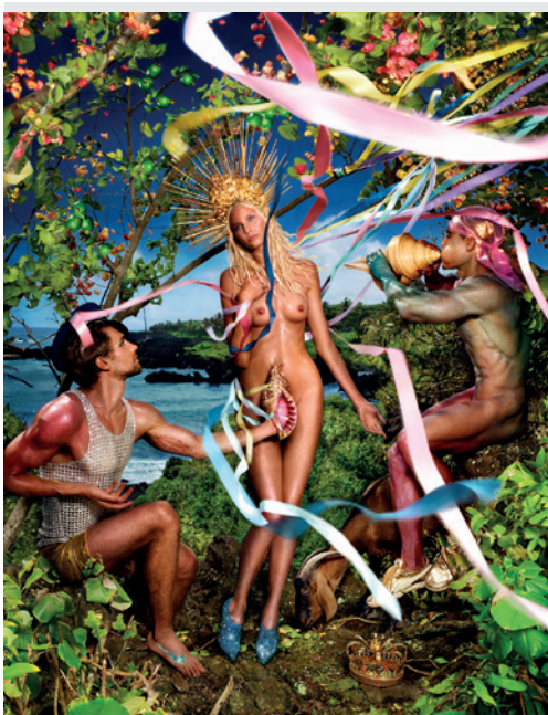
Rebirth of Venus © David LaChapelle

Ancien protégé d'Andy Warhol, il est aujourd'hui l'un des photographes les plus célèbres au monde.