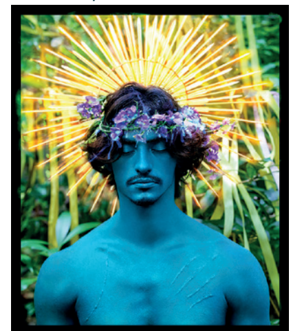
Behold © David LaChapelle

La sensibilité de chaque personne est tellement unique. On cherche à décrocher la lune en espérant que le résultat touchera le public. Il n'y a pas de recette miracle, c'est purement intuitif.